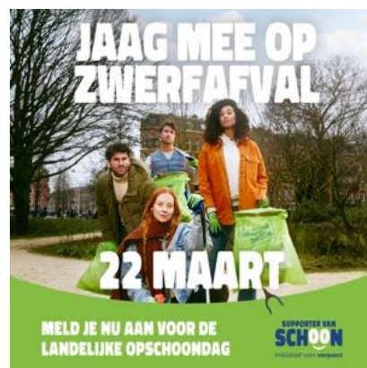
SOCIAL POST 03