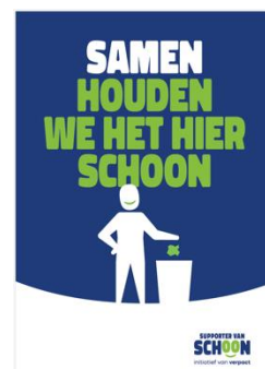
POSTER Samen houden we het schoon