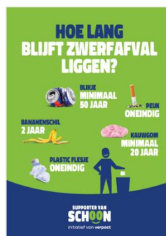
POSTER AFBRAAKTIJDE N