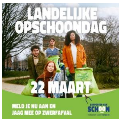
SOCIAL POST 01