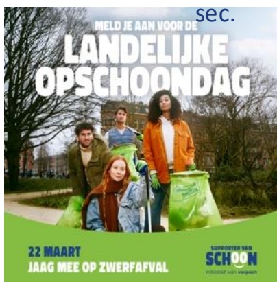
SOCIAL POST 02